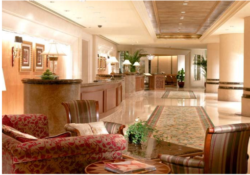
图为：北京中航泊悦酒店 (中国国际航空公司)