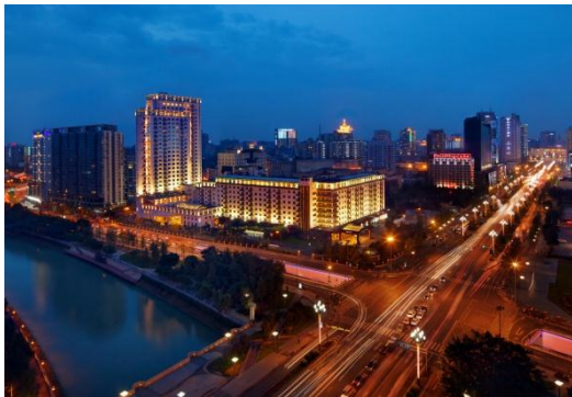
图为：锦江宾馆 (四川省旅游发展集团)