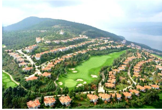
图为：春城湖畔度假村 (吉宝置业高端休闲业管理)