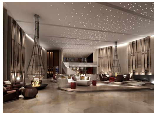
图为：青岛证大喜马拉雅酒店 (证大集团)