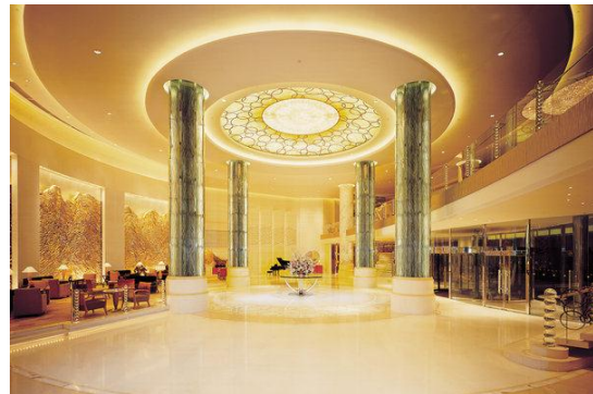
图为：昆仑饭店 (锦江国际管理有限公司)